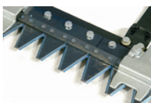
Greben kose Europa:

Ukoliko je srce kosilice je tako dizajnirano da je spremno i efikasno , takodje i aparat za košenje mora biti u efikasnom stanju, da u toku rada ima savršen rez, akumulaciju koja se obrađuje, i zahtevaju minimalno održavanje